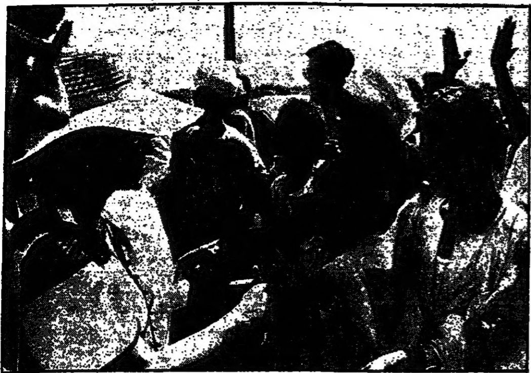
عقيلة الرئيس ناسون تصافح اهالي احدى القرى في اعالي الصعيد المصري .